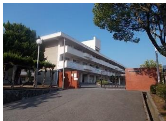
広島市立瀬野川中学校まで2408m