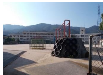
広島市立中野東小学校まで1103m