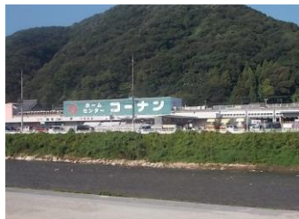
ホームセンター ホームセンターコーナン中野東店まで737m