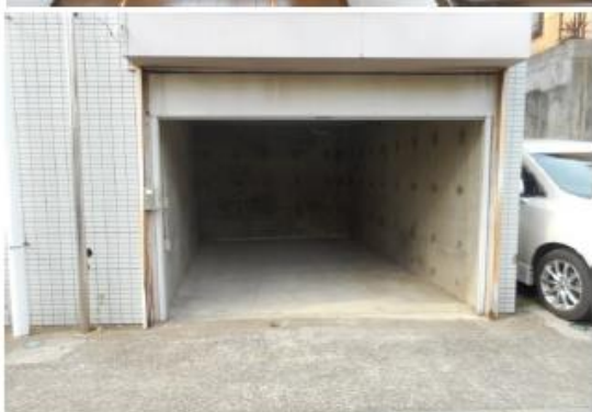
図面と現況が異なる場合は現況を優先します。